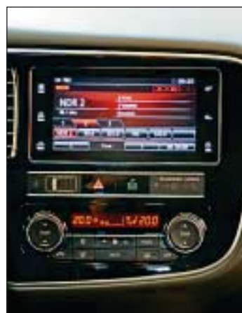
Über das große Touch-Display lässt sich unter anderem das Radio steuern.