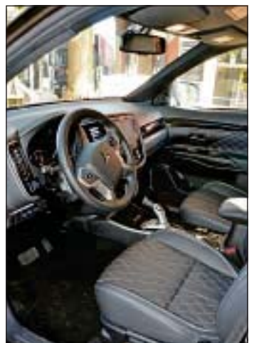
Der Innenraum bietet allen Insassen viel Platz.