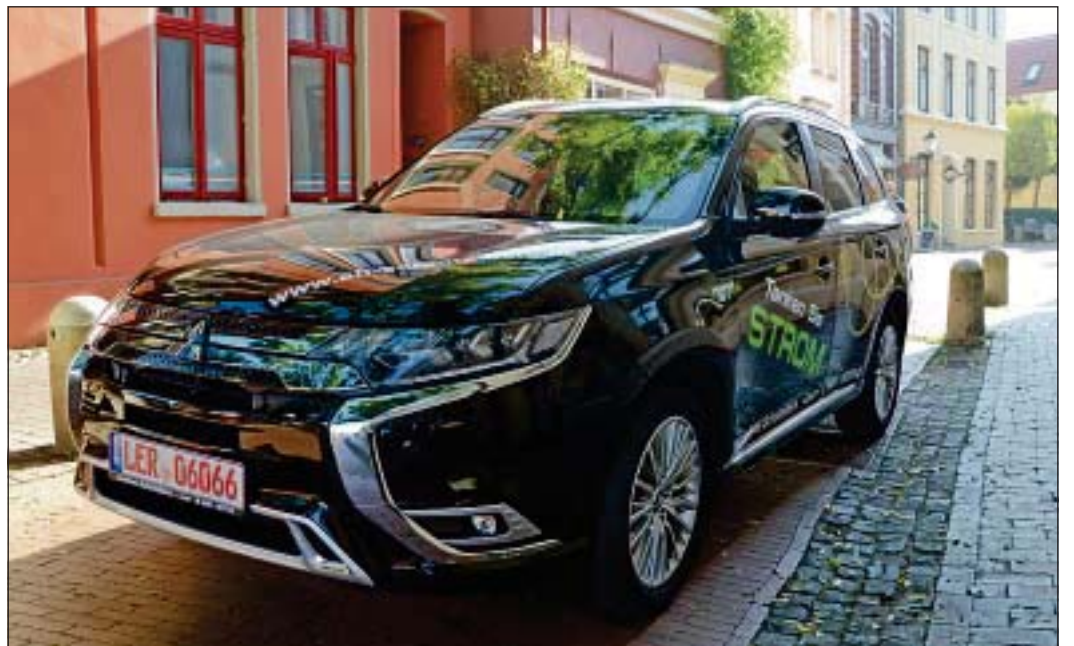
Schick und kraftvoll: der neue Outlander Plug-in-Hybrid.

■ Leer (aj) Mitsubishi hat seinen Outlander Plug-in-Hybrid zum Modelljahr 2019 kräftig aufgerüstet. Von außen betrachtet hat sich nicht viel verändert. Aber ein Blick unter die Haube lohnt sich dafür umso mehr. Beinahe lautlos gleitet der Outlander Plug-in-Hybrid durch die Innenstadt. Wo manchem Fahrzeug der Umwelt zuliebe der Weg versperrt bleibt, hat der flotte Japaner aufgrund seiner beiden Elektromotoren – einen für die Vorderachse und einen für die Hinterachse – freie Fahrt. Neuerdings tritt als Verbrennungsmotor ein 135 PS (99 kW) starker und 2,4 Liter großer Benziner mit einem maximalen Drehmoment von 211 Newtonmetern in Aktion. Die beiden E-Motoren (60 kW – 82 PS – vorne und 70 kW – 95 PS – hinten) funktioniert der Japaner bei Bedarf zu Akkus um, die ihre Elektrizität an die 80 Zellen der 300 V-Lithium-Ionen-Batterie schicken. Nutzt man den Wagen ausschließlich elektrisch, schafft er eine Strecke von bis zu 54 Kilometern Länge. Somit verfügt er über ein E-Kennzeichen, denn er liegt deutlich unter 50 mg CO 2 -Ausstoß, die Elektrofahrzeuge ausschließlich strombetrieben erreichen dürfen.