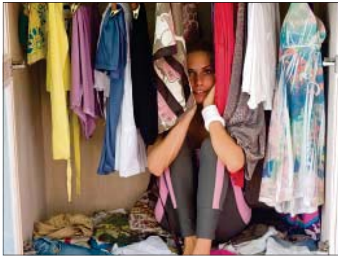
Bei Madame Floh werden Frauen fündig.

■ Leer (sr) Madame Floh zieht am Sonntag, 28. Oktober, wieder in die Ostfrieslandhalle in Leer in und modeinteressierten Frauen wird eine riesige Auswahl an guter Second-Hand-Mode, tausend Accessoires und Schmuckstücken sowie Schuhen, Gürteln, Mützen, Schals und Hüten sowie neuer Mode angeboten. Zahlreiche Frauen präsentieren von 11 bis 16 Uhr ihre Schätze aus dem Kleiderschrank. Vom Wintermantel bis zum Armreif ist alles dabei, was Frauen begehren. Für das leibliche Wohl wird gesorgt.